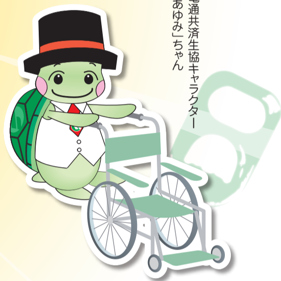
電通共済生協キャラクター「あゆみ」ちゃん